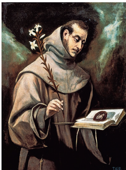
El Greco: Páduai Szent Antal

Prédikációi rendkívüli népszerűségnek örvendtek. A források szerint beszédeire ezrek gyűltek össze, különösen Páduában (Padovában), ahol