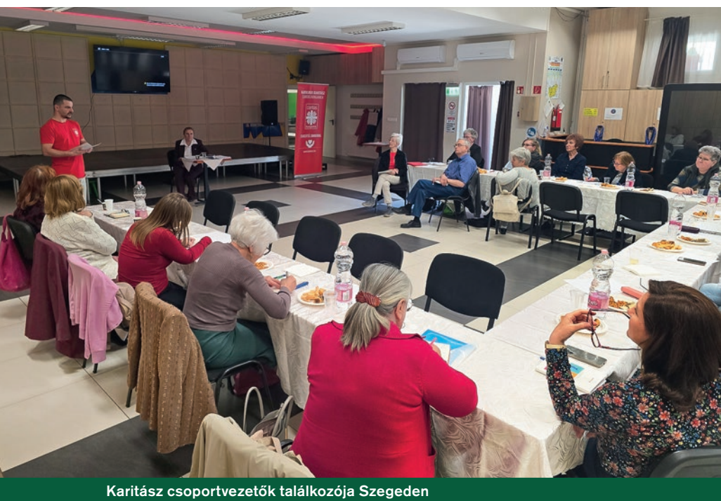
Karitás csoportvezetői találkozója Szegeden