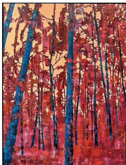
Táblaképfestészeti Biennálé 2026

A nyári képzőművészet vetésforgójában ezúttal a XXI. Szegedi Táblaképfestészeti Biennálé meghívott alkotóinak a teljes hazai képzőművészeti