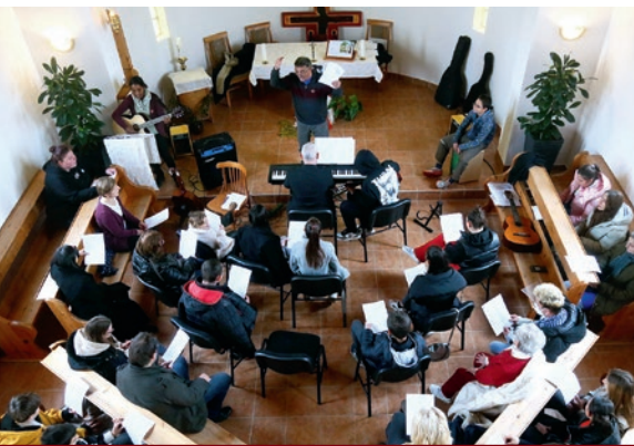
Az ÁGOTA Gyermekkorús első próbája