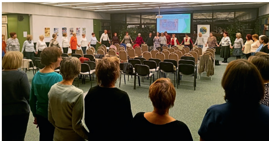
Memória Café rendezvény időseknek a Somogyi Könyvtárban

pályázatot nyert a KIFE, ezt a forrást osztotta tovább a tagszervezetek számára. Manapság már szakmai jellegű az együttműködés, a tagszervezetek az ismereteket, a módszert, a kapcsolataikat osztják meg egymással. Az eltelt három évtized alatt kibővült a hálózat, ma már keresztény szakkollégiumokkal, szociális intézményekkel és határon túli, hasonló profilú civil szervezetekkel is együtt