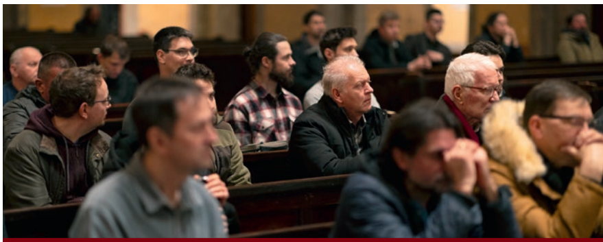
Képünk a férfiak szentségimádásán készült

Gyümölcsoltó Boldogasszony Napján, március 25-én a női kör NőiesTé programon gyűlt össze a székesegyház Mária-kápolnájában. Csendes elmélkedést követően indult templomi zarándokséta a toronyba. A „ Virágozzék ki bennem ” mottójú út során rövid páros beszélgetésekkel, közös énekléssel, körtáncal mélyítették az elmélkedést. A szentmisét – idén már negyedik alkalommal – lelki adoptálás követte.