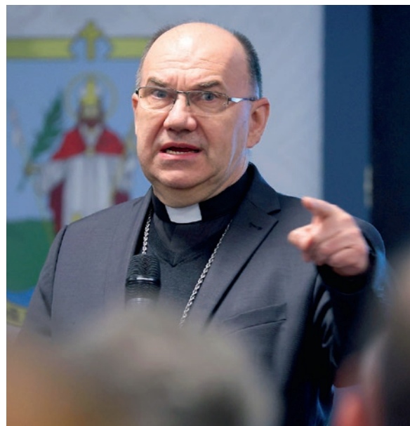
Marton Zsolt váci püspök

S mialatt haladunk, kell, hogy valami történjen közben. Egy igazi zarándoklat imádsággal, csönddel, belső változással jár, tulajdonképpen egy megtéréssel – mondta.