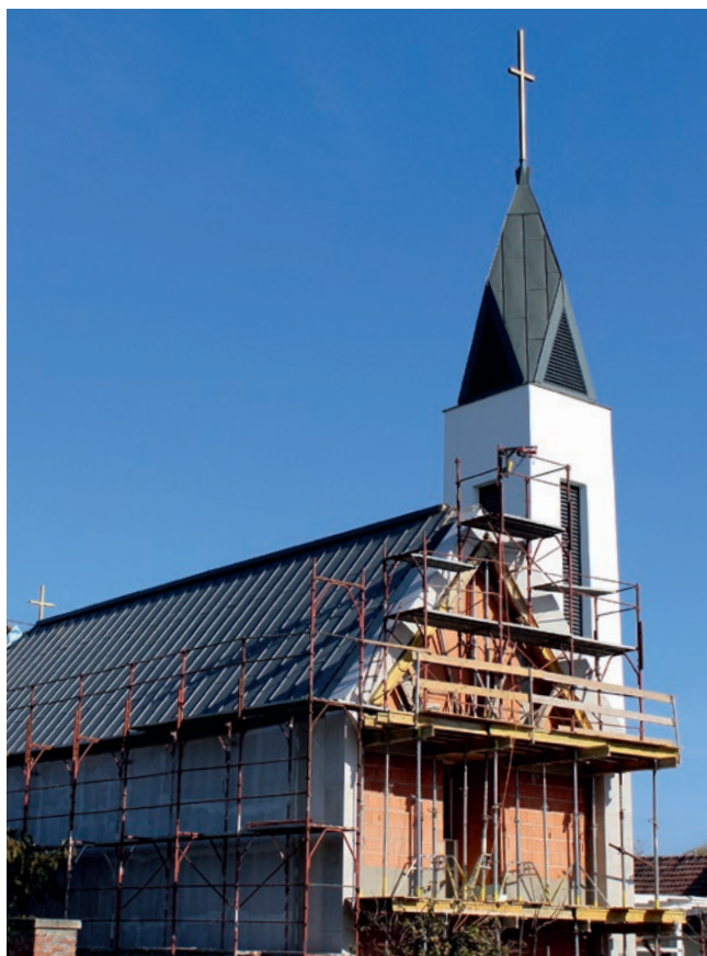
Az Okányban épülő templom