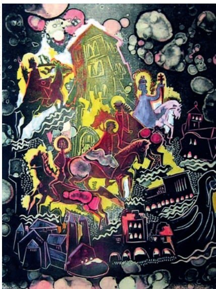
Kopasz Márta: Mit látott a kis Dömötör-torony?

Hódmezővásárhelyen a nyaranta megrendezett Kerámia Szimpózium alkotásai váltak láthatóvá az Alföldi Galériában, és a közönség betekintést nyerhetett egy magángyűjteménybe, amely olyan jeles alkotók munkáival büszkélkedhet, mint Endre Béla , Kobán György , Tornyai János vagy Szalay Ferenc , míg a Bessenyei