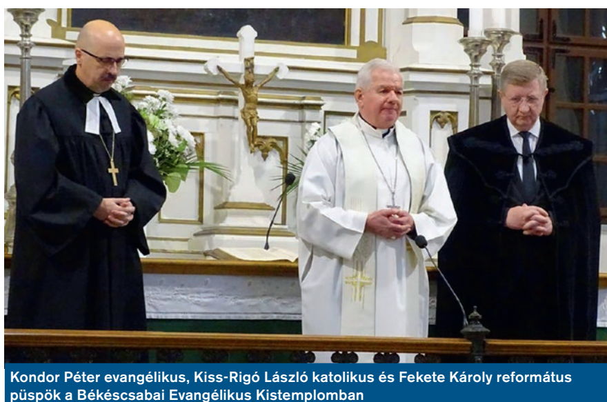
Kondor Péter evangélikus, Kiss-Rigó László katolikus és Fekete Károly református püspök a Békéscsabai Evangélikus Kistemplomban

Három püspök jelenlétében tartották meg az ökumenikus imahét keddi imaalkalmát a Békéscsabai Evangélikus Kistemplomban. A különleges alkalmon Kiss-Rigó László püspök azt mondta, az ember legnagyobb méltósága, hogy Isten gyermeke lehet.