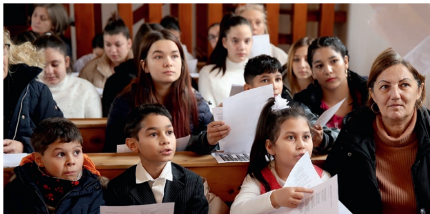
A Szent Jobb Lator-templom adott otthont a szavalóversenynek

és megértése nélkül rendkívül nehéz megszólítani őket – mondta a diakónus. A lelki gondozás sikerességének záloga, hogy az ÁGOTA Közösség pasztorációs munkatársai a különböző korosztályok nyelvén, érdeklődését, aktuális élethelyzetét is figyelembe véve a társviziókkal együttműködésben végzik tevékenységét.