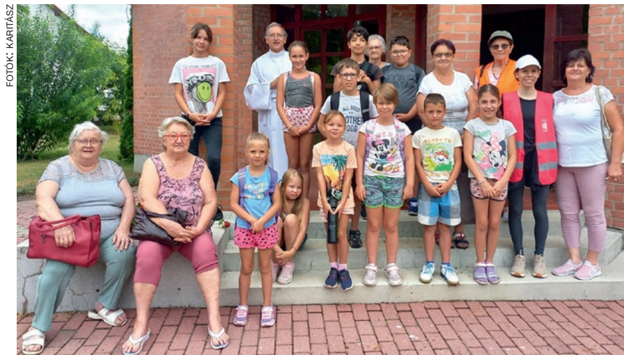
A gádorosi gyermektábor boldog arcai