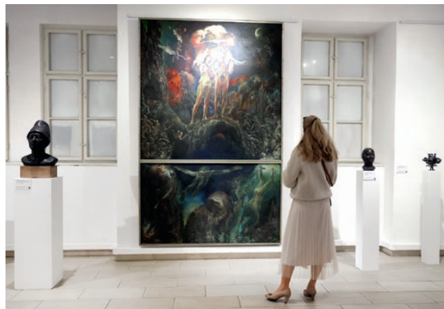
A Hetven című kiállítás a Tornyai János Múzeum Képzőművészeti Gyűjteményében található alkotásokból válogat

és A szőke ciklon című Rejtő Jenő-klasszikus színpadi változatát tűzte műsorra.