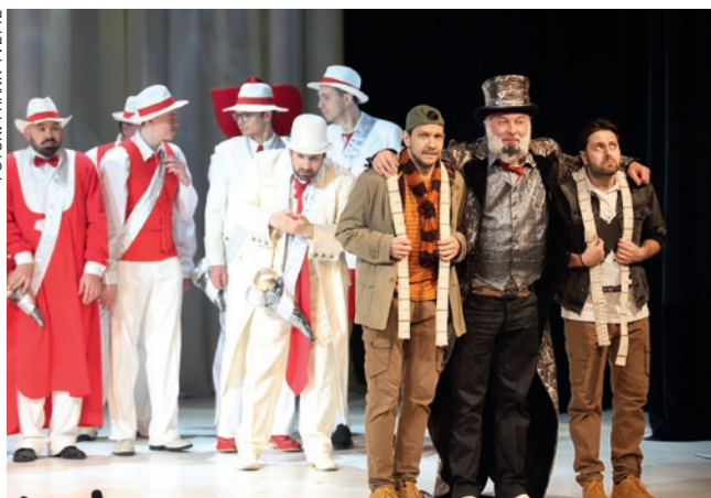
Színpadkép a Pomádé király új ruhája című gyermekoperából