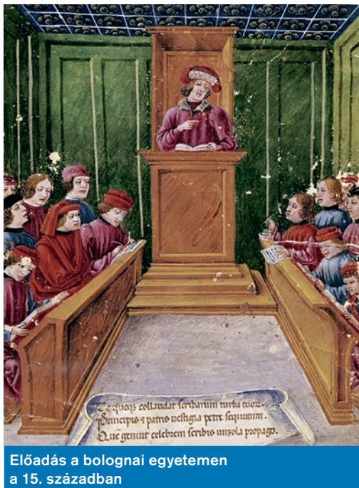
Előadás a bolognai egyetemen a 15. században

Az Evangélium c. műsor 7. évfolyamában a Katolikus leveleket dolgozza fel. Nézze Ön is vasárnaponként 8:45 órakor az M5-ös csatornán vagy a mediaklikk.hu oldalon!