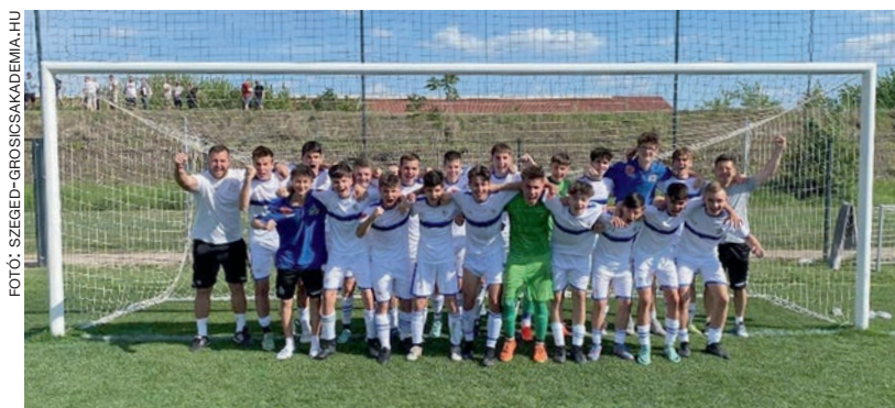
A szegedi U15-ös csapat