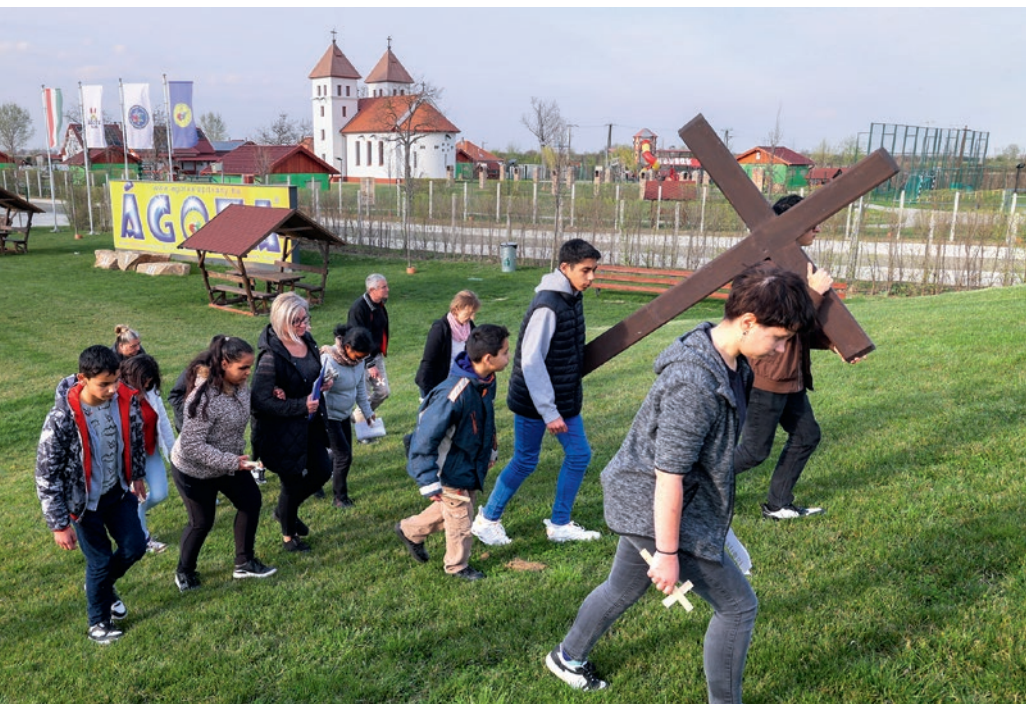
Jézus szenvedésének felelevenítése ÁGOTA Falván

Úr szenvedésével: az elítéléssel és a kigúnyolással szemben a részvét, a segítségnyújtás és az önzetlenség értékeit állítva követendő példának. A kálvária egyik stációjánál így imádkoztak: „Már kiskorom óta tudom, mi a kereszt. Megtanultam szó nélkül, zúgolódás nélkül hordozni. Nem tagadtam meg. Önmagamra forrasztott a szenvedés. Tárgyilagosan tudok beszélni róla. Érzélemmentesen. Mások azt gondolják, hős vagyok, pedig csak szenvedő.”