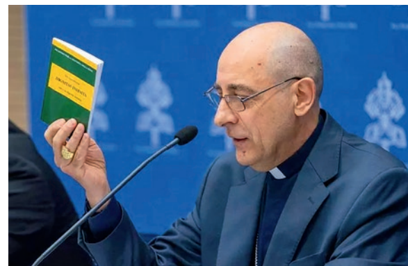
Victor Manuel Fernández bíboros a sajtótájékoztatón

közötti megszüntethetetlen nemi különbségekre való hivatkozás elhomályosítására irányuló minden kísérletet”. Abigail Favale, a University of Notre Dame gender-kutatója szerint ez a kijelentés nem csupán azt jelenti, hogy a nemi megjelenés megváltoztatására irányuló orvosi kísérletek összeegyeztethetetlenek az emberi méltósággal, hanem „az a nyelvhasználat is, amely elhomályosítaná a nemi különbségek valóságát”. Lezögezte: „Ez egy elég világos irányelv a Vatikántól, és úgy gondolom, hogy a hatékony lelkipásztori gyakorlat csak az ilyen egyértelmű útmutatásból fakadhat”.