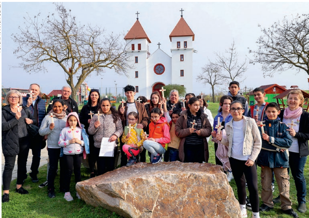
Az ÁGOTA Közösség fiataljai a Szent Jobb Lator-templom előtt