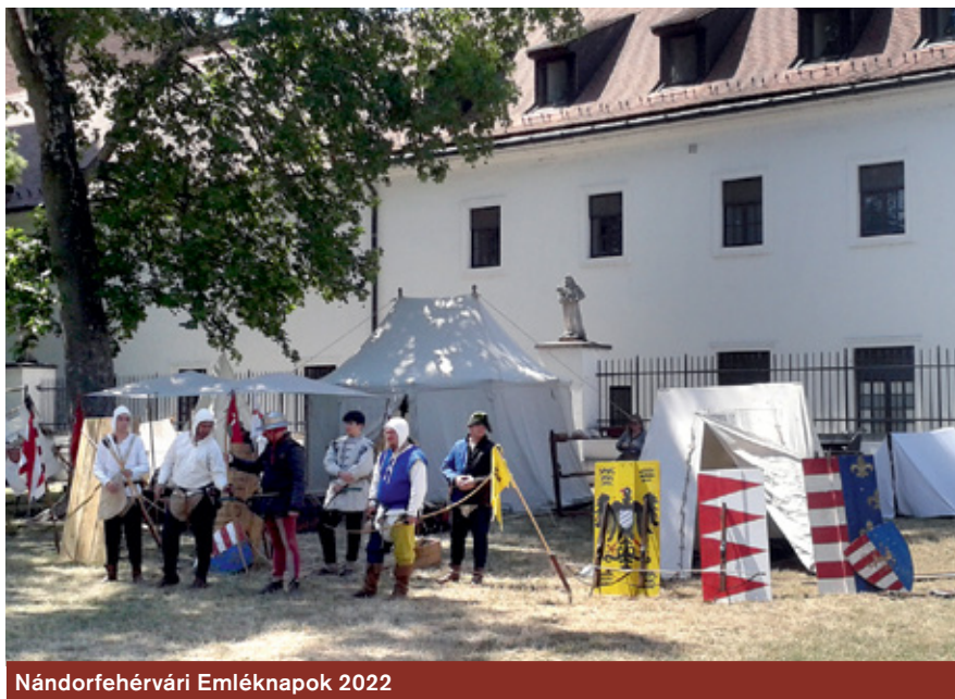
Nándorfehérvári Emléknapok 2022