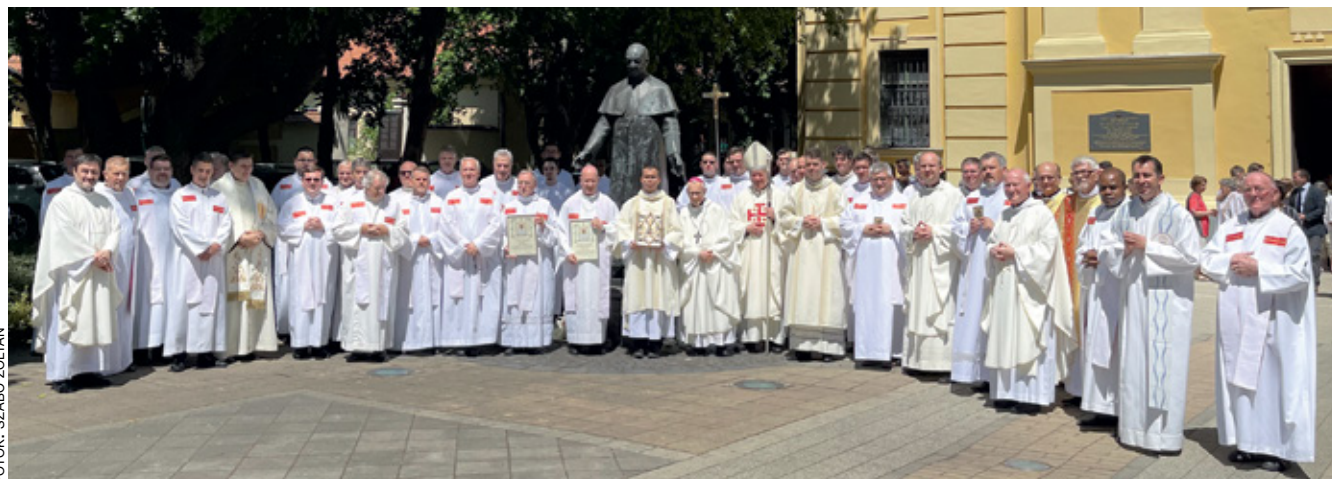
FOTÓK: SZABÓ ZOLTÁN