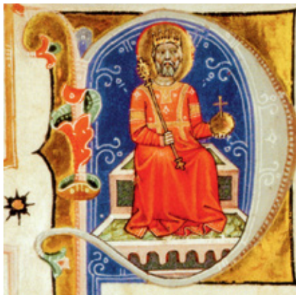
Szent István ábrázolása a Képes krónikában, 14. század

Szent István államalapító és állam-szervező tevékenységének elismerése, s politikai és egyházi kultusza nagy lendületet kapott a két világháború között. A trianoni békediktátummal területének kétharmadától megfosztott országban a kormányzat Szent István Kárpát-medencei történelmi államának újraegyesítésében