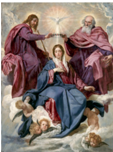
Diego Velázquez: A Szűz megkoronázása, 1635/36. (Madrid, Prado.)