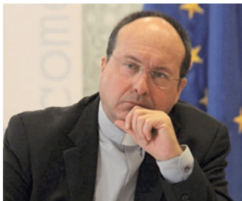
A COMECE főtitkára, Manuel Barrios Prieto

Kijelentette, hogy az Európai Parlament nem léphet olyan területre, mint például az abortusz, amely nem tartozik hatáskörébe, és nem avatkozhat be demokratikus uniós vagy nem uniós országok belügyeibe, és hozzátette: a radikális politikai napirendi pontok előmozdítása veszélyezteti az alapvető jogokat, beleértve a gondolat-, lelkiismereti és vallásszabadságot, a véleménynyilvánítás szabadságát, a gyülekezési szabadságot, és rombolja a társadalmi kohéziót.