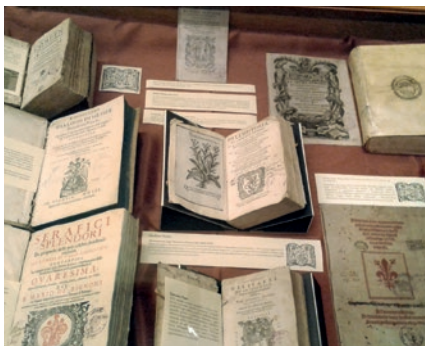
Venei könyvsodák a Somogyi-könyvtárban

A korszak élenjáró nyomdái-könyvkiadói vetekedtek a mívesen metszett és szedett, lenyűgöző látványt nyújtó könyvlapok és a műtárgynak is beillő, nemes anyagokból készült, számos esetben aranyozott könyvborítók előállításában. Az új művészeti ág két legjelentősebb központja Velence és Amszterdam volt. Az alapításának 1600. évét ünneplő, tengerre épült városban működő edíciók ritkaságai messze földre is eljutottak, hogy főúri gyűjtemények büszkeségeivé váljanak. Minthogy alapítója, Somogyi Károly esztergomi kanonok egyszerre ügyelt páratlan gyűjteményének tudományos és könyvészeti értékére, a Somogyi-könyvtár régikönyves gyűjteménye gazdag anyagot őriz a venei könyvművészet remekeiből – köztük nem egy ősnymtatvánnyal. Idénynyitó tárlatuk ebbe a kincstárba enged bepillantást: egyebek közt a kimagasló műveltségű humanista, Aldus Manutius ( Aldo Manuzio ) műhelyéből, akinek többek között a dőlt betűs és szabályosan központosított írást vagy éppen az előszó