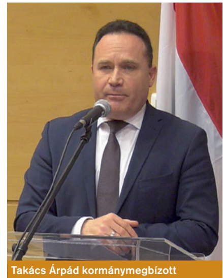
Takács Árpád kormány megbízott