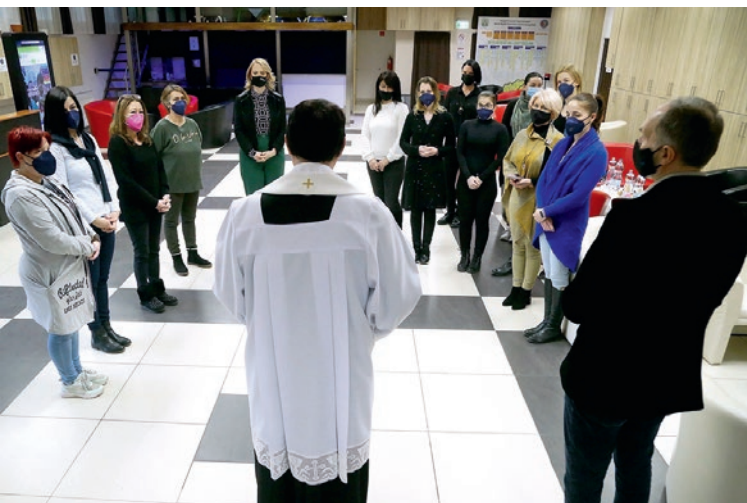
Idén a Szent Ágota Gyermekvédelmi Szolgáltató szegedi, Csongor téri központi épületét is megszentelték

A vér szerinti családjukból kiemelt gyermekek ma már nem nagylétszámú intézetekbe, hanem nevelőszülőkhöz vagy lakásotthonokba kerülnek. Az ilyen közösség esélyt ad arra, hogy ők is megélhessék, megtapasztalják a szeretetteljes törődést. A szolgáltató gondoskodásában lévő közel hétezer gyermek nagy része nevelőszülőknél él, kisebb részük, mintegy négyszáz fiatal pedig kislétszámú, családi lakásotthonokban.