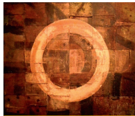
Székács Zoltán: A Purgatórium kapuja