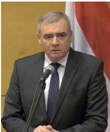
Szabó István honvédelmi államtitkár