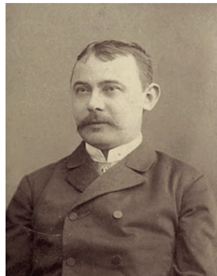
Mikszáth Kálmán mint fiatal újságíró 1878 és 1880 között Szegeden dolgozott

vallás- és közoktatásügyi miniszter erélyes föllépése eredményeként tarthatta meg tisztségét. Kreminger nem nyugodott bele tervezett eltávolításába, s Nyílt Válasz címmel reagált az őt ért támadásokra, melyben fölserolta a magyar kormány szolgálatában szerzett érdemeit: „Két zászlót is szenteltem, a 6-kat és a 8-kat, a honért lobogókat. Utóbbit Márczius 15-kén a szent-rókusi, az elsőt Augustus 4-kén 1848-ban a palánki szentegyházakban.” E védőírára Nyáry Ferenc, a liberális meggyőződésű szeged-rókusi lelkész Nyílt Felvilágosítás című röpiratában válaszolt, amelyben élesen bírálta és sértően támadta a prépostot. Kreminger Antal – akinek papi pályáját legalaposabban Zakar Péter professzor dolgozta föl az egyházmegyénk fönntartásában működő Gál Ferenc Egyetem folyóirata, a Deliberationes egyik nemrég kiadott számában – tehát ugyan ellentmondásos alakja Szeged történetének, Mikszáth Kálmán révén azonban személye – ugyan csupán marginálisan, de – része lett a magyar irodalomtörténetnek.