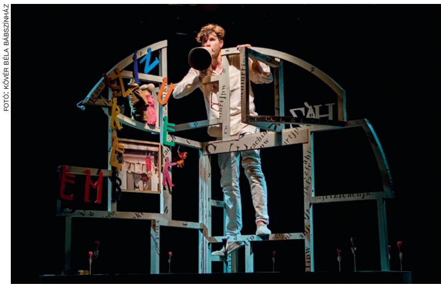
A 3 emeletes mesekönyv

Digitális Színházterem elnevezéssel minden héten elérhetővé tesznek Youtube-csatornájukon régebbi és közelmúltban játszott darabokat. Mint beavatószínház, ifjúsági és kortárs műveket feldolgozó előadások szerepelnek kínálatukban. Tíz perc rádiószínház címmel általános iskolákat szólítanak meg. A magyar klasszikus és kortárs irodalom gyerekek által könnyebben befogadható írásaiból, mesékből és novellákból készítene