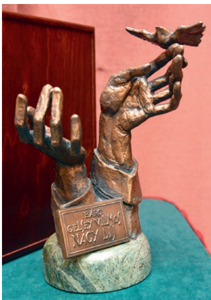
A Báró Gelsey Vilmos-nagydíj