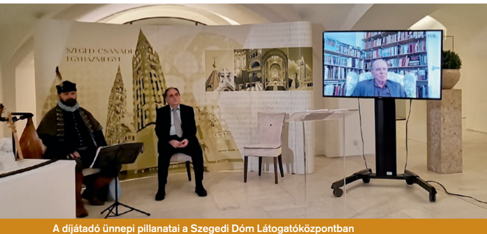
A díjátadó ünnepi pillanatai a Szegedi Dóm Látogatóközpontban