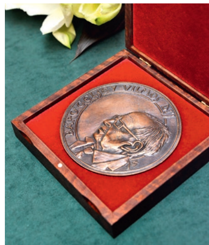
A Báró Gelsey Vilmos-díj