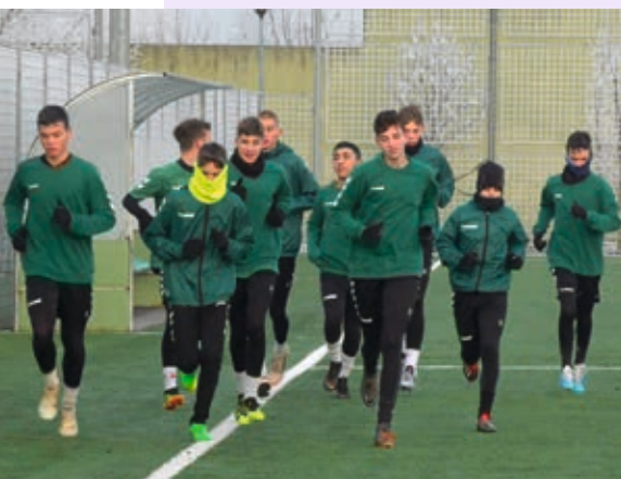
A januári hideg sem hátráltatta a felkészülést