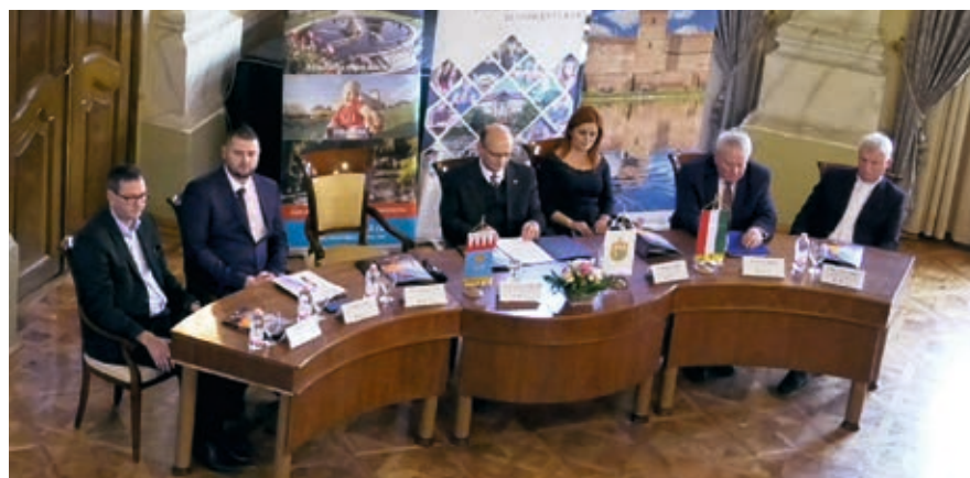
A konferencia előadói

Az eseményt kerekasztal-beszélgetés zárta, melyen a résztvevők az egészségturizmus szervezésében végzett jó gyakorlataikat osztották meg a közönséggel. A gyulai városháza előterében az érdeklődők egy kisebb kiállítást is megtekinthettek, mely a fürdővárosban közel harminc éve működő felsőoktatás jeles pillanatait mutatta be korabeli újságcikkek és fényképek segítségével.