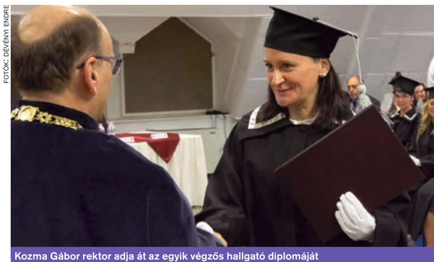
Kozma Gábor rektor adja át az egyik végzős hallgató diplomáját

korábban szereztek már meg oklevelüket. Nekik is a felsőoktatás keretében kell folyamatosan megújulniuk, és tudniuk kell alkalmazni az ott tanultakat.