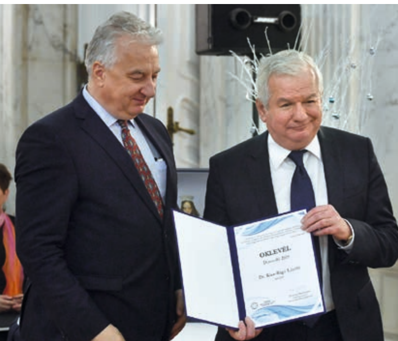
Semjén Zsolt miniszterelnök-helyettes és Kiss-Rigó László püspök az oklevéllel

Az Evangélium c. műsor 4. évfolyamában Pál apostol leveleit dolgozza fel. Nézze Ön is vasárnaponként 7:30 órakor az M5-ös csatornán, vagy a mediaklikk.hu oldalon!