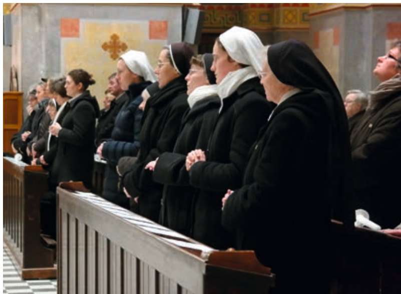
Domonkos rendi iskolanővérek Hódmezővásárhelyről