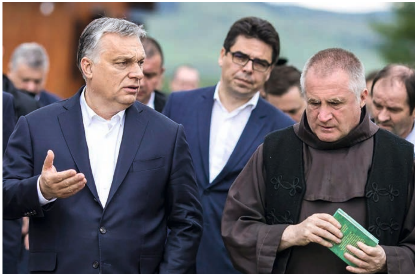
Együtt a két magyar „Év embere”: 2019 májusi erdélyi körútja során Orbán Viktor miniszterelnök Bőjte Csaba ferences szerzetest, a Dévai Szent Ferenc Alapítvány alapítóját is meglátogatta