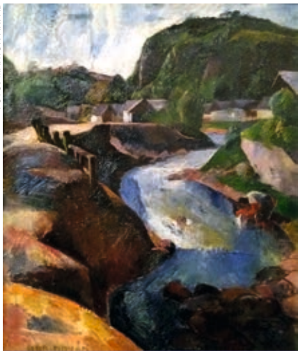
Aba-Novák Vilmos: Felsőbányai táj