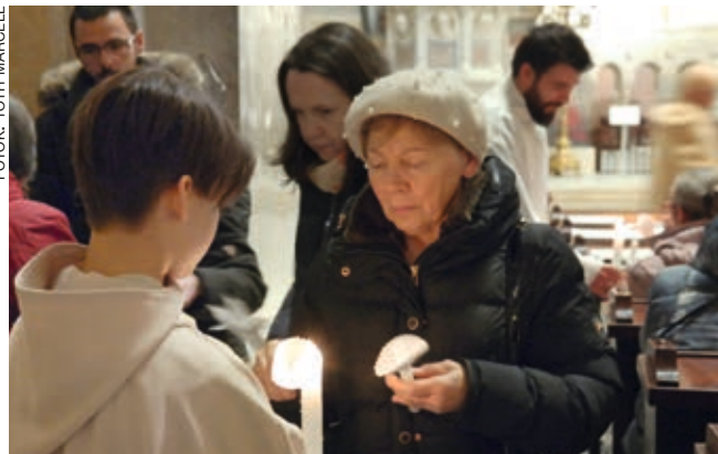
A hívek gyertyáit a ministránsok gyűjtik meg a szentmise elején